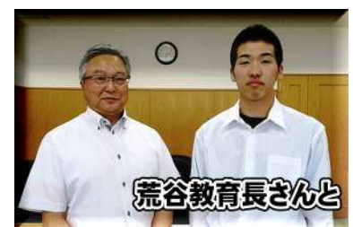
荒谷教育長さんと